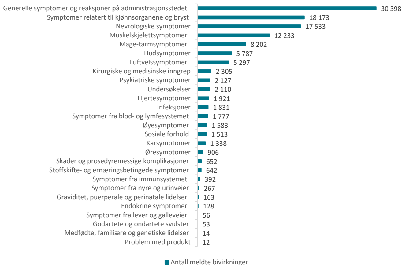
Tabell 7: Meldte mistenkte bivirkninger fordelt etter kategori for Comirnaty og Spikevax

En melding kan inneholde flere bivirkninger og dermed er det langt flere bivirkninger enn meldinger.