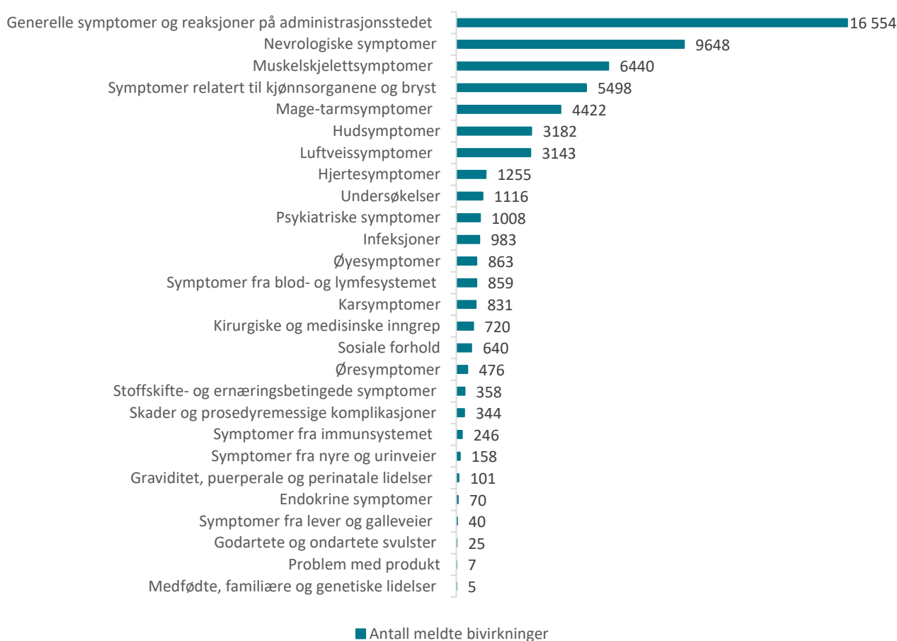
Figur 1: Meldte mistenkte bivirkninger fordelt etter kategori Comirnaty og Spikevax

De hyppigst meldte symptomene etter mRNA-vaksinene er hovedsakelig kjente bivirkninger i kategorien "Generelle symptomer og reaksjoner på administrasjonsstedet": reaksjoner på injeksjonsstedet eller i vaksinasjonsarmen, nedsatt allmenntilstand, feber, generell sykdomsfølelse, hodepine, svimmelhet, søvnighet, diaré, kvalme og oppkast. Symptomene er oppstått i løpet av 1-2 dager etter vaksinasjon, og er som regel gått over i løpet av noen få dager.