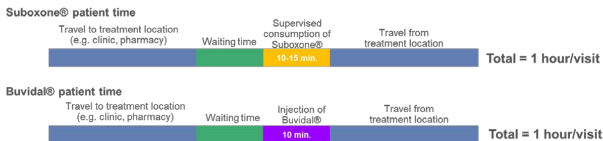
Figure 1. Patient time per visit estimates in Camurus base case

NOTE: bar lengths for illustration, not to scale