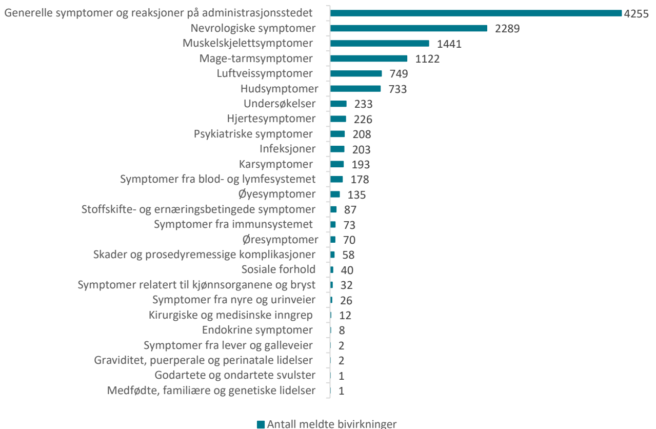
Figur 1: Meldte mistenkte bivirkninger fordelt etter kategori for mRNA-vaksiner (Comirnaty og COVID-19 Vaccine Moderna)

De hyppigst meldte symptomene etter mRNA-vaksinene er hovedsakelig kjente bivirkninger innenfor kategorien generelle symptomer, som dekker reaksjoner på injeksjonsstedet, nedsatt allmenntilstand, feber og generell sykdomsfølelse. Hodepine, svimmelhet og søvnighet etter vaksinasjon er også hyppig meldt, i tillegg til mage-tarmsymptomer som diaré, kvalme og oppkast. Symptomene er oppstått i løpet av 1-2 dager etter vaksinasjon, og er som regel gått over i løpet av noen få dager. Det er mottatt noen meldinger der pasienten har opplevd infeksjoner som lungebetennelse og influensa. Da mRNA-vaksinene ikke er levende kan de ikke forårsake sykdommen det vaksineres mot eller andre infeksjoner.